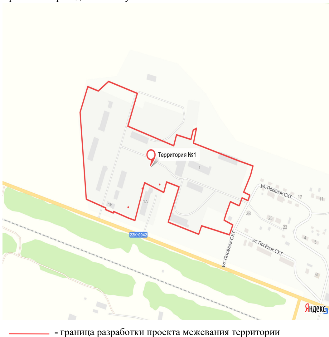
Рисунок 1. Схема расположения границ территории разработки проекта межевания

Схема расположения границ территории разработки проекта межевания в целях образования земельных участков путём перераспределения земельных участков с кадастровыми номерами 52:44:0400001:943, 52:44:0400001:3 и земель, государственная или муниципальная собственность на которые не разграничена приведена на Рисунке 1: